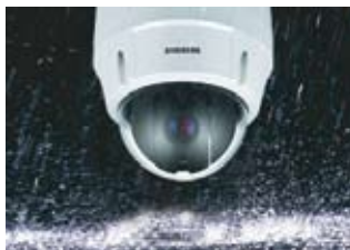
Résistante aux Intempéries

Ayant été conçue en vue des conditions les plus adverses, la caméra SNC-C6225 est parfaitement adaptée pour des installations en extérieurs, grâce à sa structure spéciale qui résiste à l'eau et à la poussière.