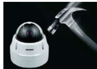
Résistante au Vandalisme